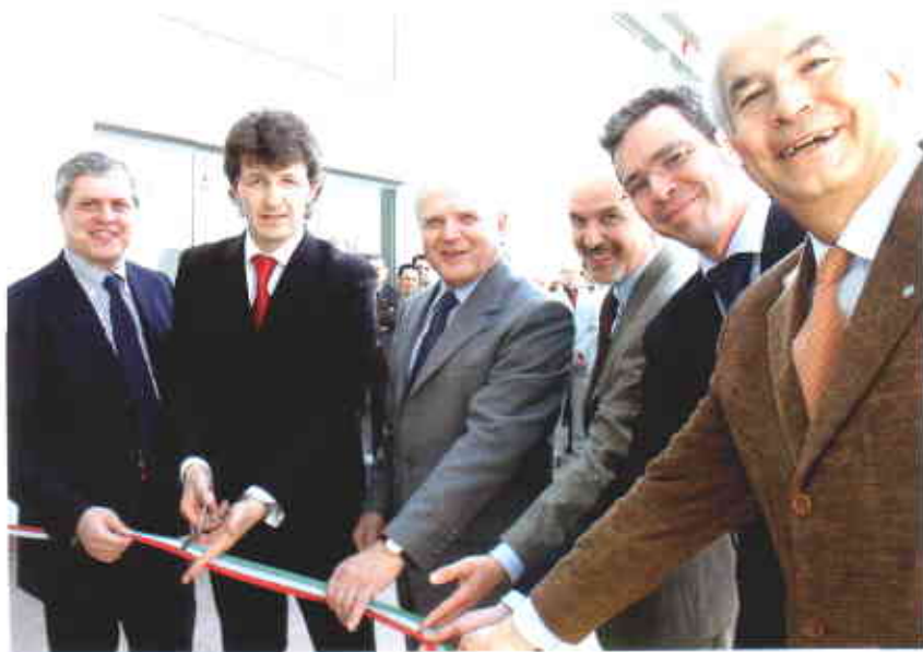
Nella foto: il taglio del nastro.

hanno una distribuzione dei sanitari tale da permettere l'inserimento di idonei punti di appoggio e si è avuto cura di evitare sporgenze ed ostacoli nella composizione degli spazi. Il piano interrato ospita l'autorimessa con ampi spazi di manovra, direttamente collegata al corpo scale per facilitare l'accesso agli alloggi. L'area verde sul retro degli edifici è suddivisa in piccoli giardini privati per gli alloggi al piano terra, mentre gli appartamenti al primo piano fruiscono come spazio esterno privato di terrazzini coperti. Questa scelta, unita all'accesso separato ad ogni unità abitativa, è stata dettata dalla volontà di mantenere il più possibile il senso di privacy e di individualità degli alloggi sia per quanto riguarda lo spazio interno che quello esterno, pur garantendo la possibilità di spazi collettivi di socializzazione individuati nelle sale comuni al piano terra e nella piazza centrale.