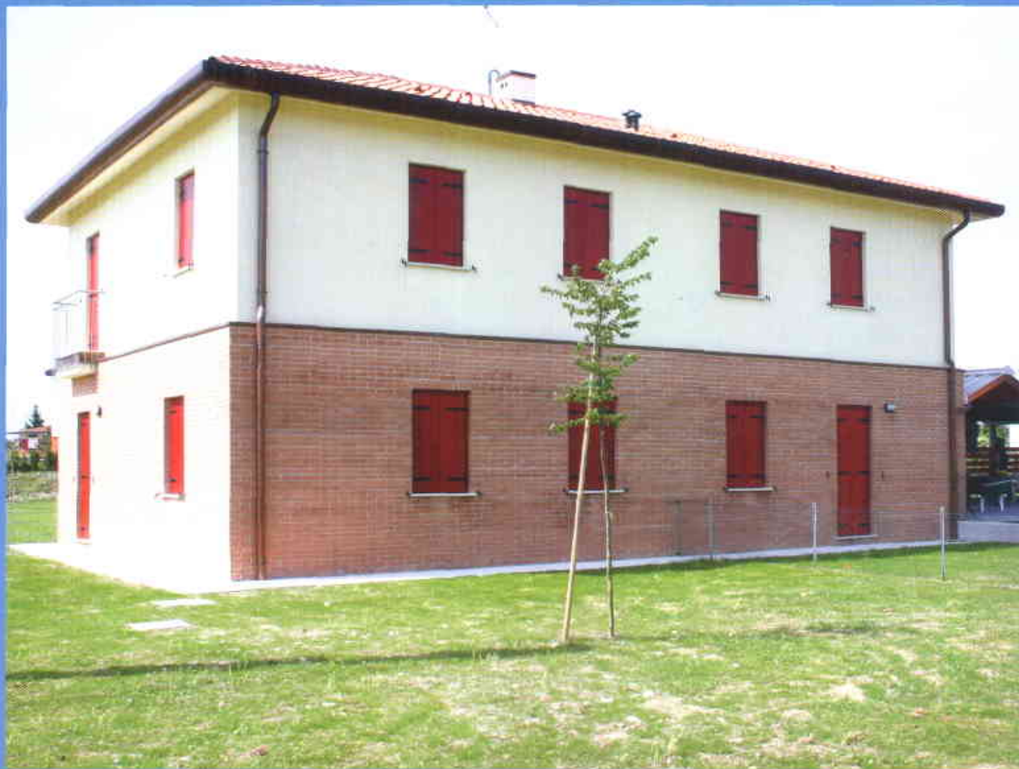
Nervesa della Battaglia

Anno X, n. 1, Ottobre 2006 - Poste Italiane spa - Spedizione in Abbonamento postale - 70% - DCB TV - Autorizzazione del Tribunale di Treviso n. 702 del 5/5/1988