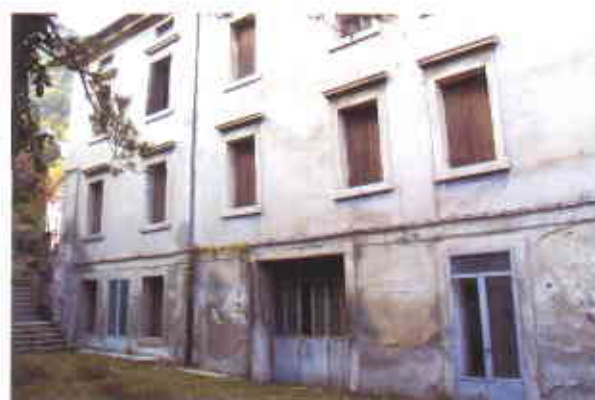
Nella foto: un particolare del fabbricato da ristrutturare di Vittorio Veneto (Ex Ospedale di Serravalle).

continuativi, per un costo complessivo dell'intervento pari ad Euro 1.920.745,29 interamente finanziato con fondi derivanti dalle vendite relative alla L. 560/93.