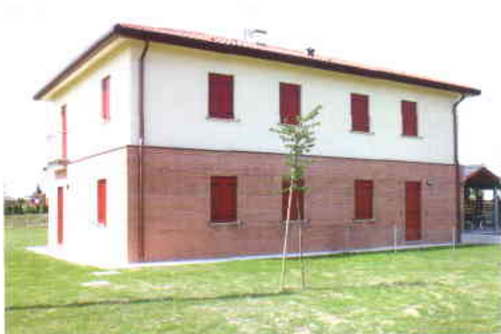
In copertina: Nervesa della Battaglia - Via Priula, 12 alloggi.