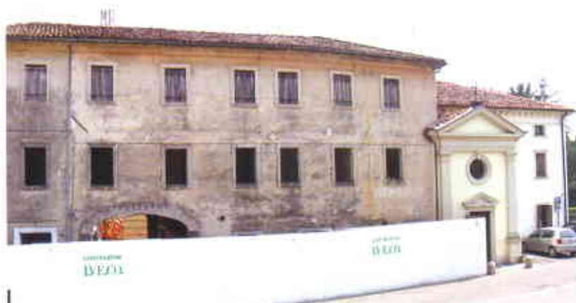
Nella foto: un particolare del fabbricato da ristrutturare di Cappella Maggiore.

quattro alloggi dei quali tre situati nel fabbricato principale, accessibili da una scala comune e serviti da ascensore, ed uno ricavato nell'attuale annesso rustico, accessibile direttamente dal cortile interno al fabbricato mediante una scala indipendente. Il secondo piano del fabbricato principale, accessibile da una scala comune e servito da ascensore, sarà lasciato al grezzo in attesa che l'Amministrazione comunale decida la destinazione da dare ai locali. E' prevista inoltre la ricostruzione della porzione di annesso rustico non più esistente che avrà le dimensioni di quello preesistente. L'area esterna sarà destinata in parte a verde e in parte sarà sistemata con pietrisco.