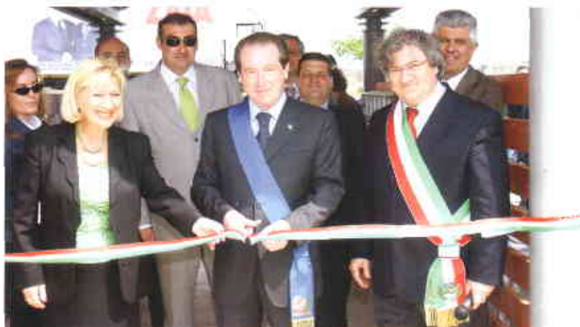
Nelle foto: tre momenti della consegna con il Presidente ATER, il Sindaco di Nervesa della Battaglia e il Presidente della Provincia.