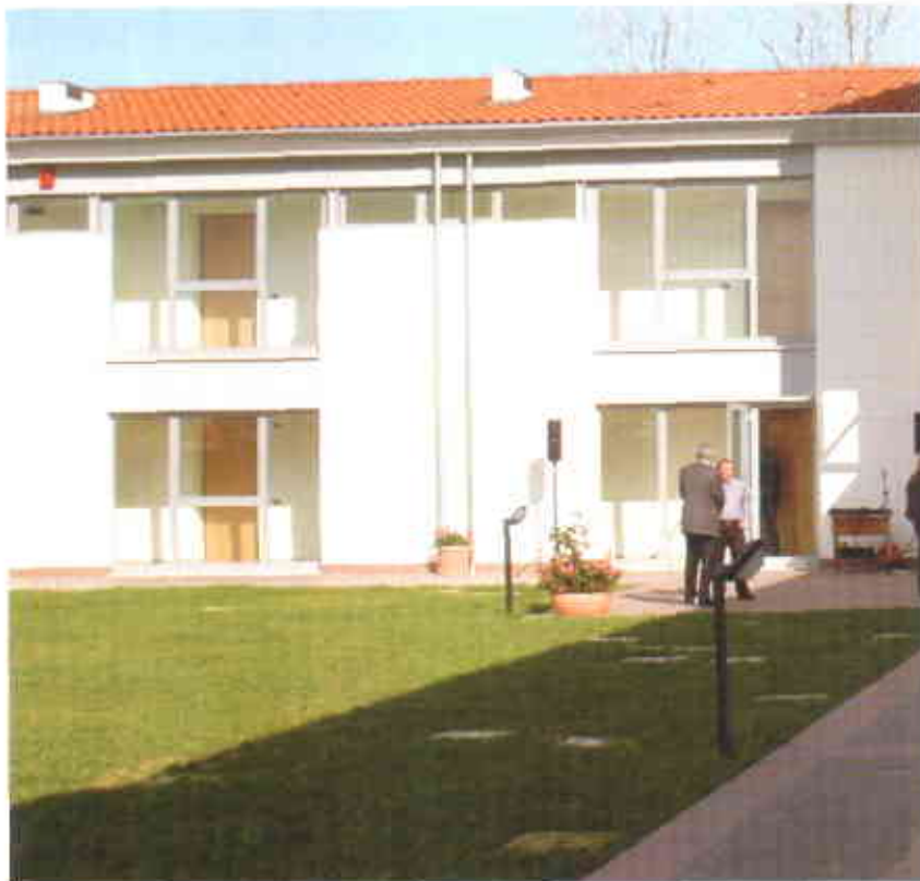
Nella foto: un particolare del fabbricato di 15 alloggi a Vedelago.

L'intervento rientra nell'ambito di un accordo di programma ai sensi della legge 23.12.96 n° 662 per la definizione e la realizzazione di un piano integrato che prevede la realizzazione e l'adeguamento di servizi sociali, socio assistenziali, socio sanitari e veterinari nel Comune di Vedelago e che comprende una Residenza Sanitaria Assistenziale (R.S.A.) per un totale di 120 posti letto per anziani non autosufficienti ed altre tipologie di assistiti. Quest'ultima struttura sarà realizzata dall'O.I.C. onlus di Padova. Sono previsti inoltre la costruzione di un edificio destinato ad ospitare la sede periferica del Distretto Socio-Sanitario di base e dei Servizi Veterinari dell' ULSS 8, realizzato a cura del Comune di Vedelago e la ristrutturazione, a cura dell'ATER, dell'edificio denominato "Villa Galli" attuale sede dell'IPAB "Mons. L. Crico", per destinarlo a nuove attività di carattere socio sanitario o sociale (comunità alloggio per disabili, abitazioni protette, abitazioni per famiglie o