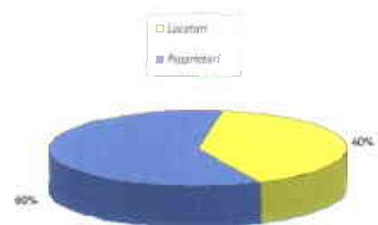
PERCENTUALE LOCATARI IN FABBRICATI ATER IN PIANO DI VENDITA

La manutenzione dei fabbricati nelle parti comuni è condivisa con i proprietari determinando un aumento dei costi di gestione visto che, per ogni singolo intervento, è necessaria la preventivazione dello stesso e l'approvazione in assemblea. Nel grafico è riportato il rapporto esistente tra coloro che sono in locazione e coloro che sono in proprietà nei fabbricati inseriti nel piano di vendita.