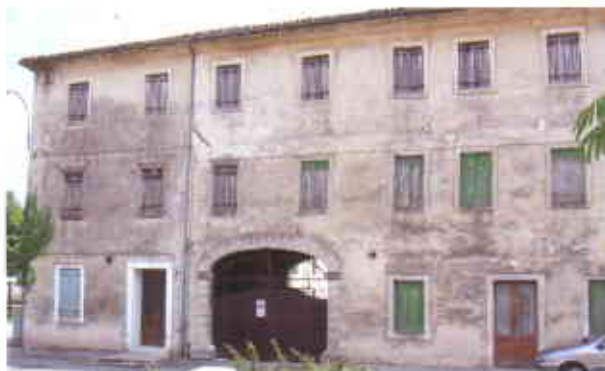
Nella foto: due particolari del fabbricato da ristrutturare di Cappella Maggiore.

Da via Giardino si accederà direttamente a due locali a disposizione dell'amministrazione comunale posti al piano terra, con annessi servizi. Al primo piano saranno ricavati