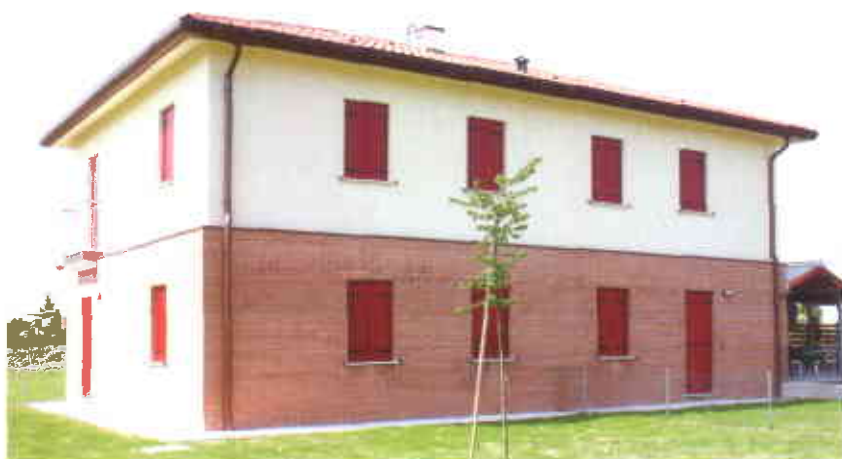
Nella foto: uno dei fabbricati di Nervesa in via S.P. n. 248 Priula.

La composizione del nucleo familiare degli assegnatari varia da una a quattro persone.