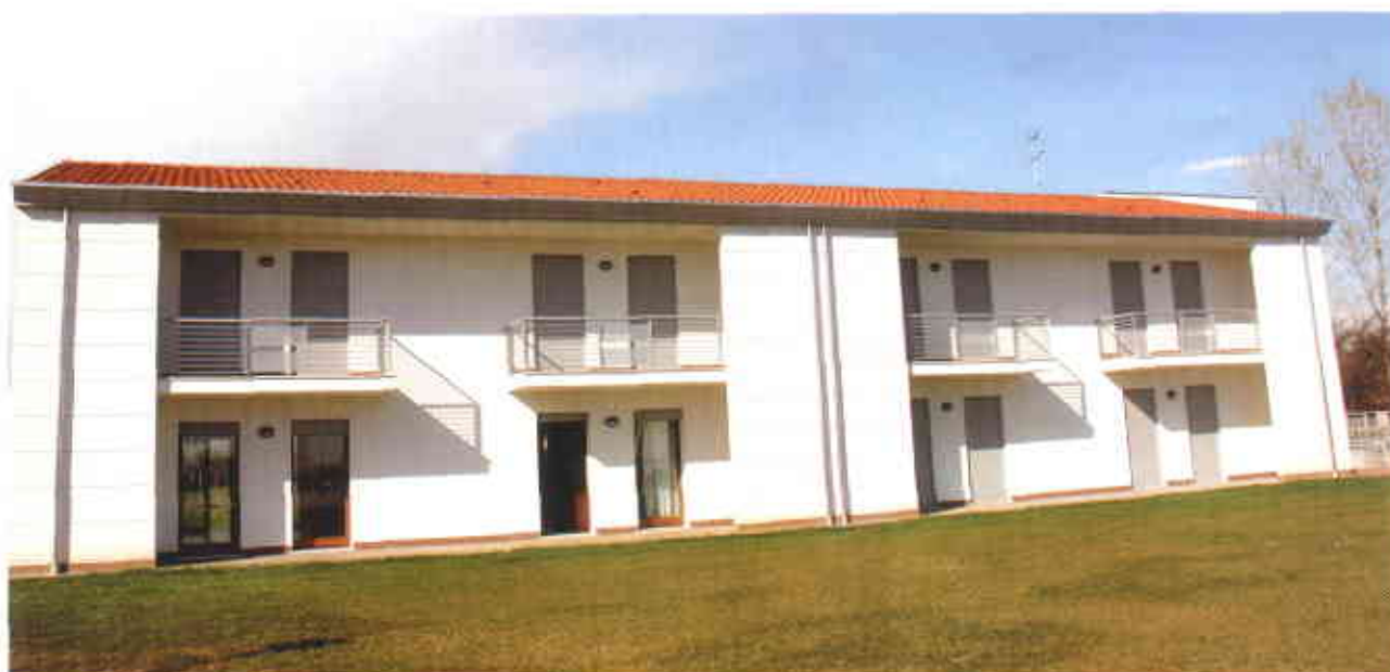
Nella foto: un particolare del fabbricato di 15 alloggi a Vedelago.

l'IPAB "Mons. L. Crico" che dovrà garantire il rientro delle spese sostenute per l'esecuzione dell'opera.