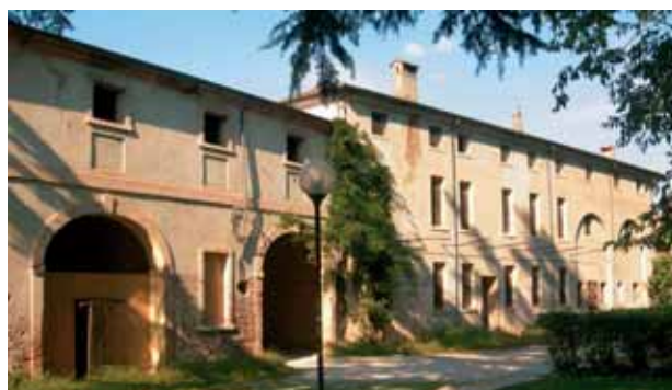
Villa Baroni nello stato attuale.

Villa Baroni destinata a residenza, restando riservate in piena proprietà ed uso al Comune sia la parte lato ovest (barchessa) che il piano terra parte est della Villa.