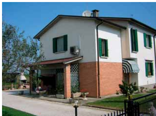
Roncade, Ca' Tron.

In Comune di Roncade, località Ca' Tron sono in corso di esecuzione i lavori di ripassatura della copertura e la tinteggiatura facciate. Il costo presunto è di circa 179 mila Euro.