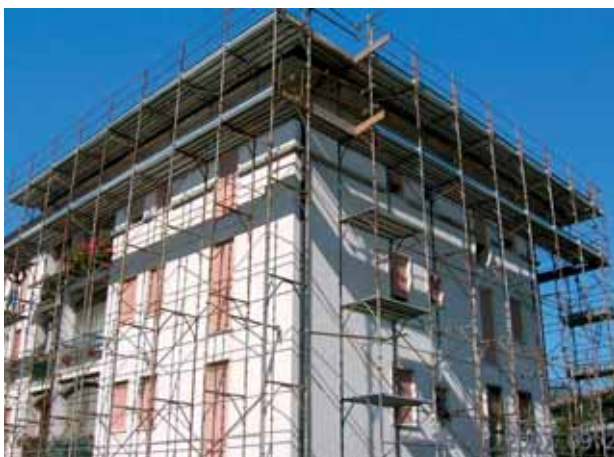
Lavori in uno dei fabbricati di Vittorio Veneto.

A Vittorio Veneto, via BuoZZi, ai civici 1,3,5 e 7 è stata effettuata la ripassatura dei tetti di due fabbricati. Ciascuno dei due fabbricati è composto da 18 alloggi. Il costo complessivo sostenuto è pari a 120.000,00 Euro.