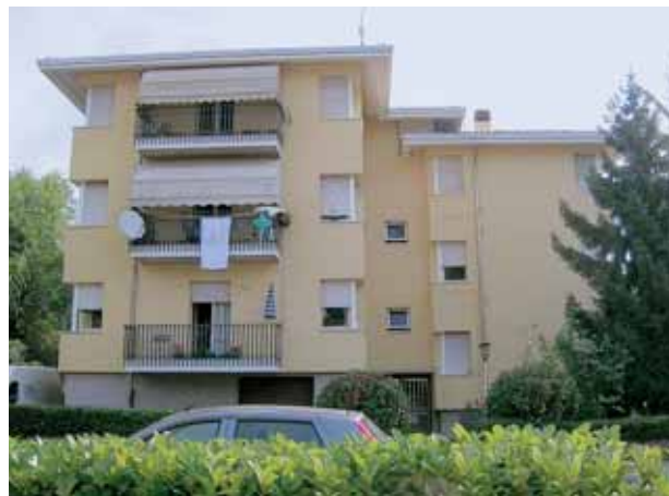
Il fabbricato di v.le Nazioni Unite dopo l'intervento.

al fine dell'aumento dell'isolamento termico del fabbricato. I lavori rientrano negli obiettivi di risparmio energetico. Il costo complessivo è stato di 40.000,00 Euro.