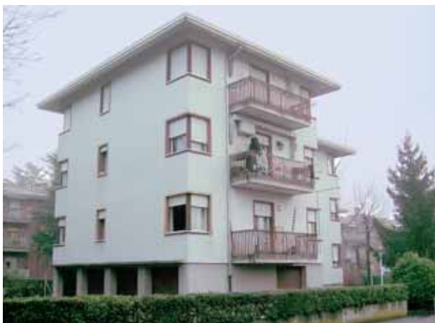
Un fabbricato di Treviso, v.le Nazioni Unite prima dell'intervento.

Sono stati ultimati i lavori di ripristino della copertura di due fabbricati siti in Treviso viale Nazioni Unite. L'intervento è stato effettuato per la posa di una guaina isolante e la sistemazione delle pareti esterne con posa di cappotto esterno