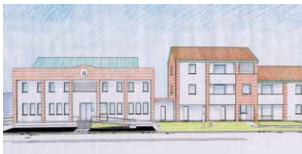
Veduta prospettica del progetto.

Si è concluso con l'affidamento all'impresa AMA ECG srl di Casale sul Sile il procedimento per l'appalto di costruzione della nuova sede della caserma dei carabinieri e degli alloggi di servizio in comune di Valdobbiadene per un importo contrattuale di Euro 1.328.974,76. I lavori avranno inizio entro il mese di ottobre e si concluderanno dopo 540 giorni dall'inizio stesso. La caserma e gli alloggi saranno quindi dati in locazione al Comune di Valdobbiadene, che potrà anche provvedere ad acquisire il fabbricato in proprietà.