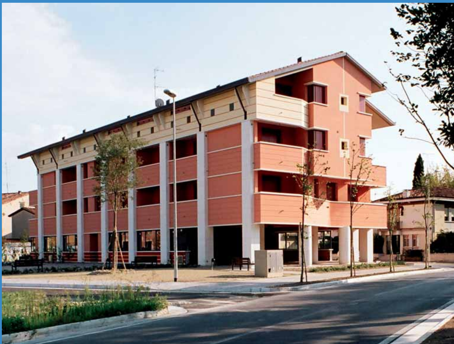
Oderzo, via Roma ex Stadio, 18 alloggi

Anno XI, n. 2, Ottobre 2007 – Poste Italiane spa - Spedizione in Abbonamento postale - 70% - DCB TV - Autorizzazione del Tribunale di Treviso n. 702 del 5/5/1988