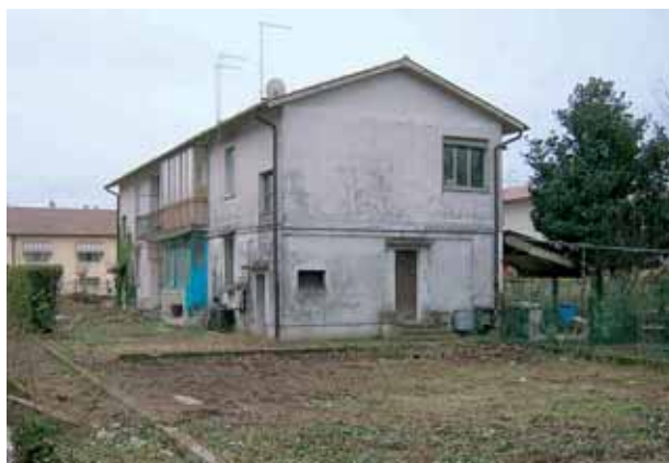
Il fabbricato da ristrutturare a Maserada.

Si tratta di un intervento che si inserisce negli obiettivi fissati da una delibera della Giunta Regionale del Veneto che ha deciso di finanziare, concedendo un contributo pari al 70 per cento, interventi di recupero di alloggi sfitti per far fronte all'emergenza abitativa, autorizzando il ricorso alla procedura negoziata, ossia a trattativa privata.